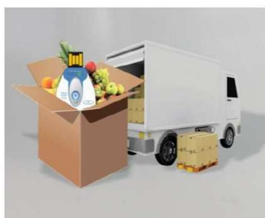
Umieść w przesyłce