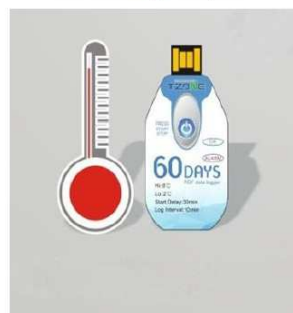
Rejestruj temperaturę przesyłki