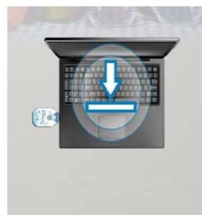
Odczytaj w PC raport PDF